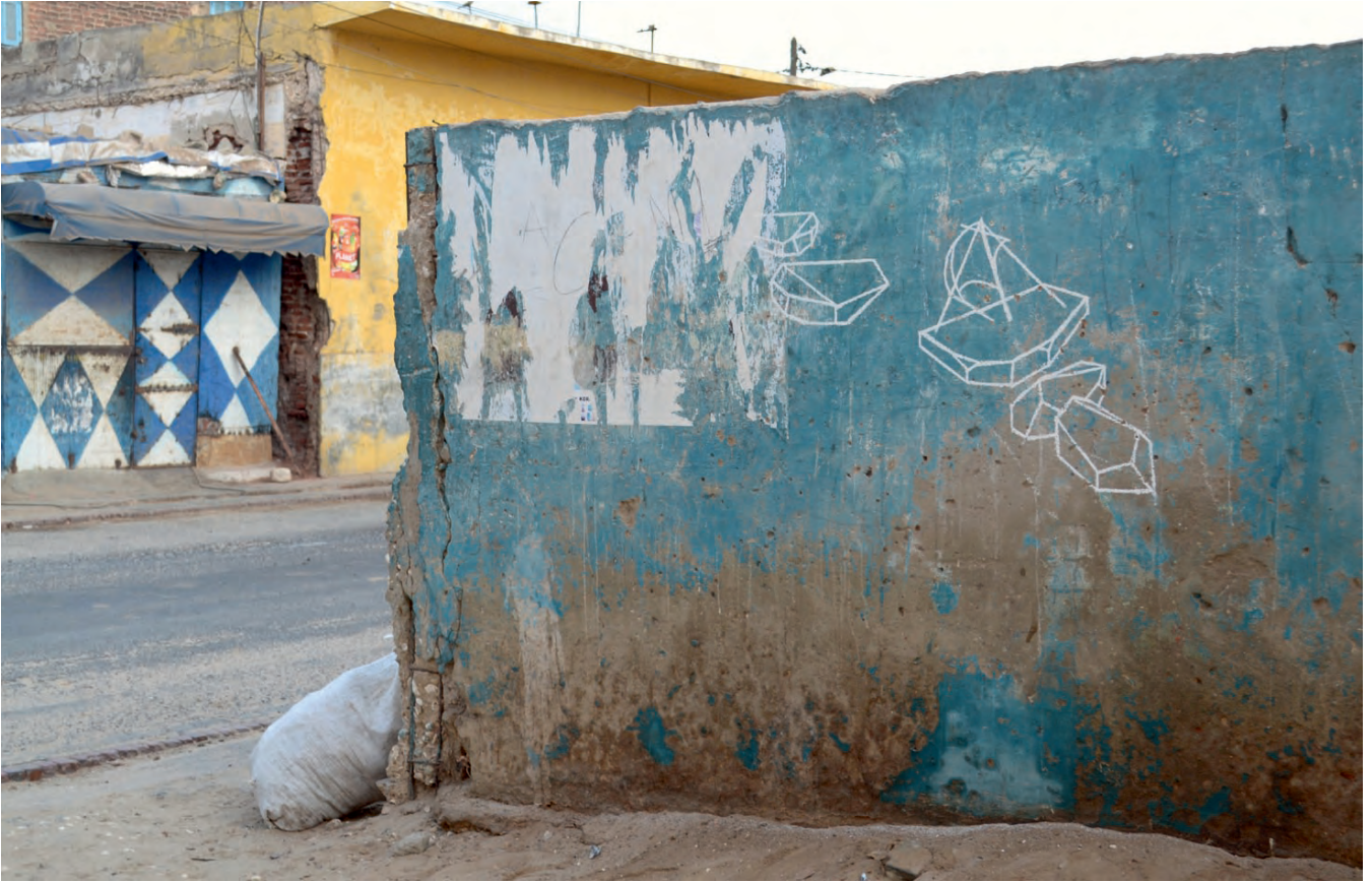
„L'éphémère disparu“ (Rue Blaise Diague) - chalk, drawing in public space, Saint-Louis, Senegal, 2013“