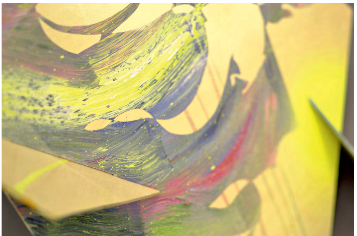
„Rigg“, oil/varnish on wood, 65 x 120 x 90 cm, 2013 - Detail