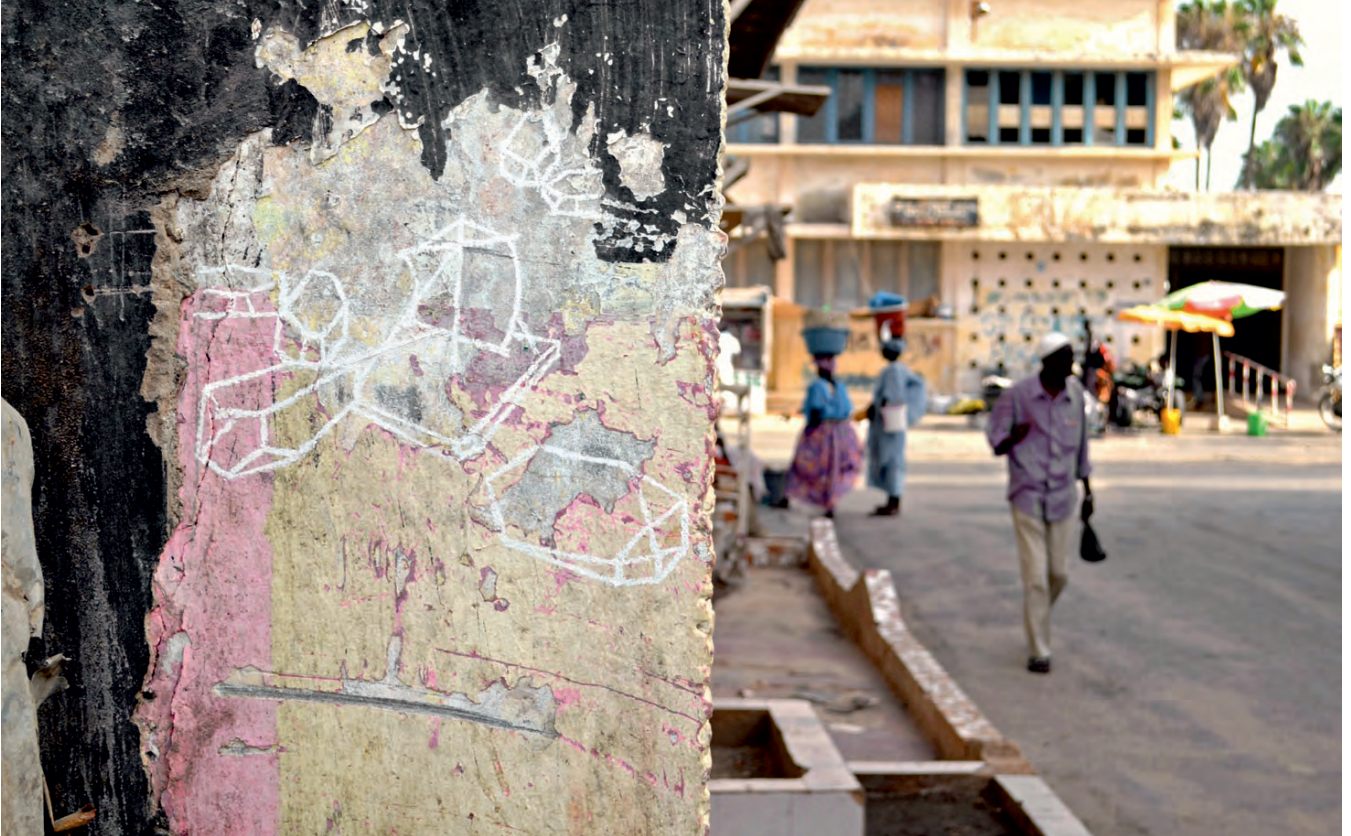
„L'éphémère disparu“ (Rue Bisson) · chalk, drawing in public space, Saint-Louis, Senegal, 2013”