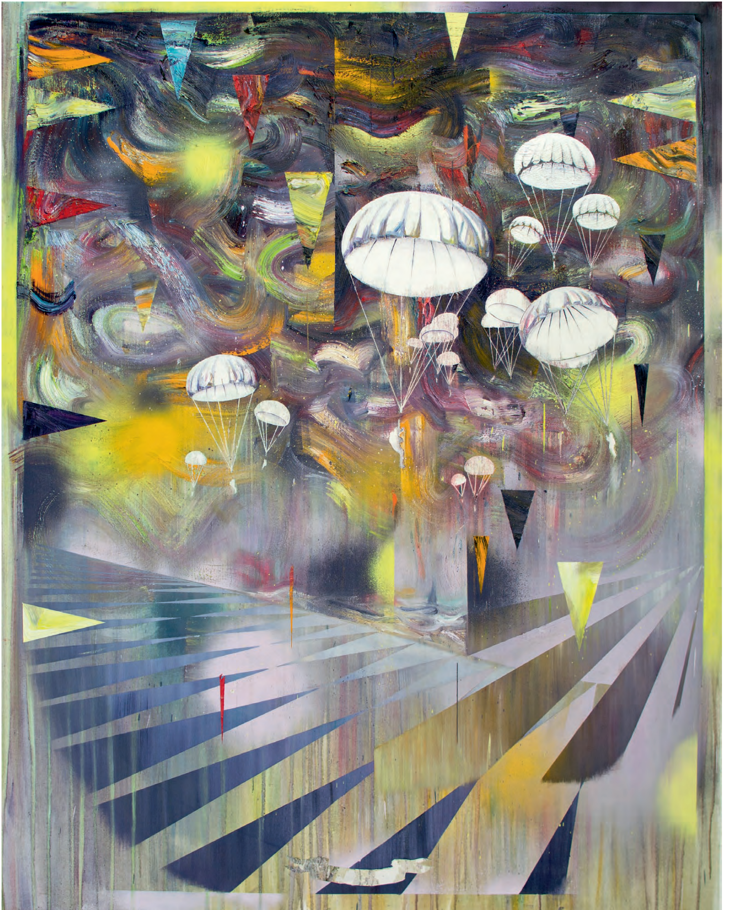
„Landung“ · oil/varnish on canvas, 190 x 160 cm, 2017