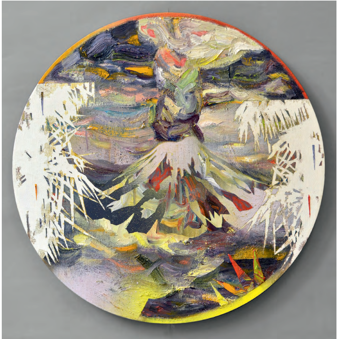
„Tambora I“ · oil/varnish on canvas, 60 x 60 cm, 2017