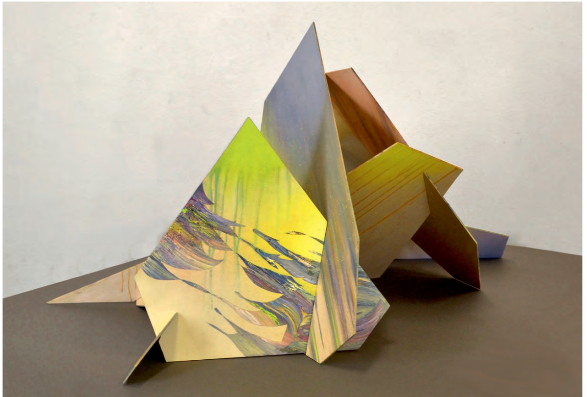
„Rigg“, oil/varnish on wood, 65 x 120 x 90 cm, 2013