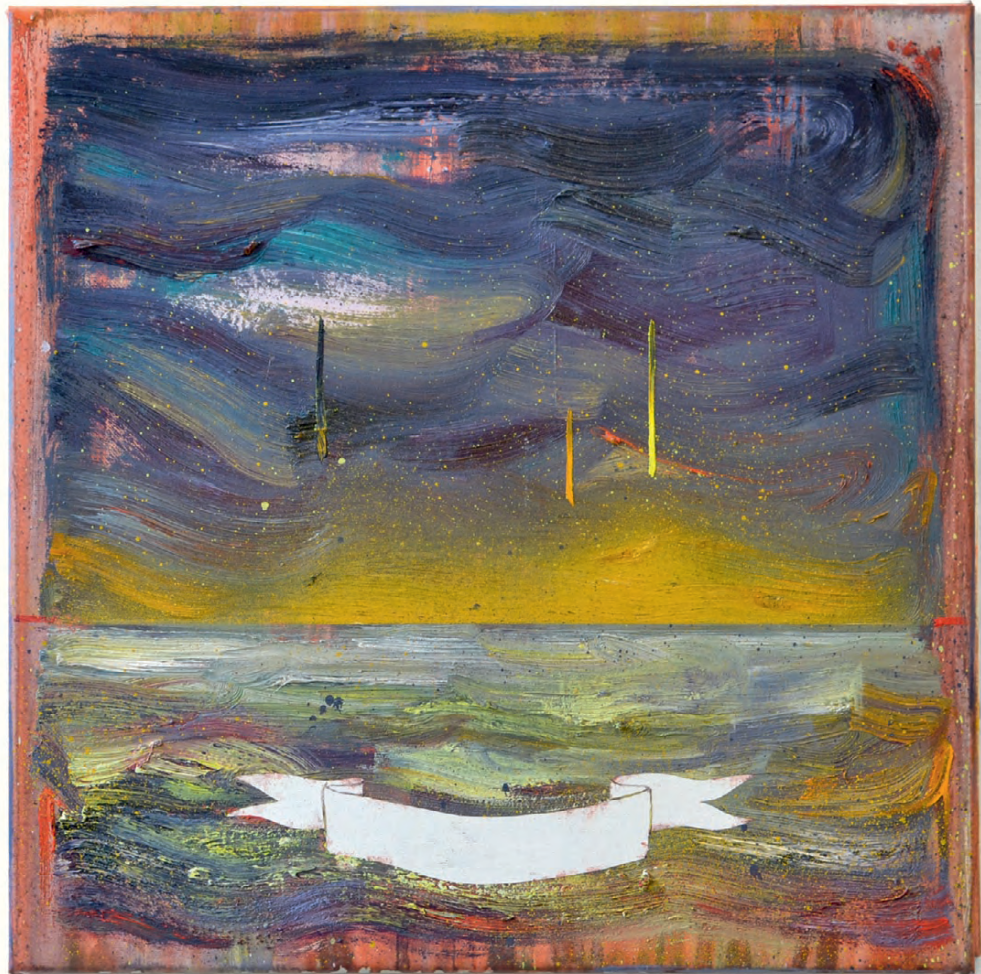
„Étude III “ · oil/varnish on canvas, 40 x 40 cm, 2016