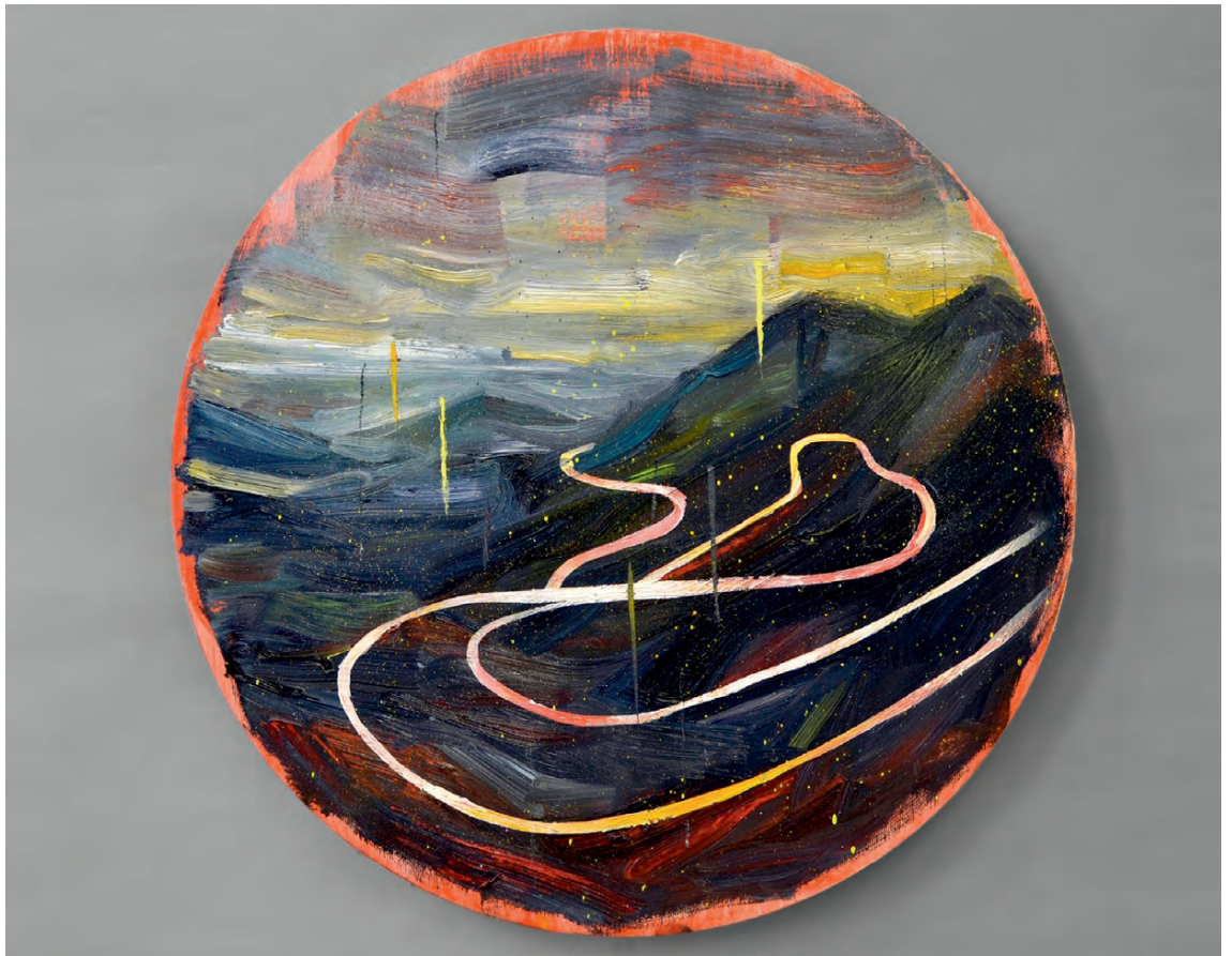
„Pass I“ · oil/varnish on canvas, 40 x 40 cm, 2016