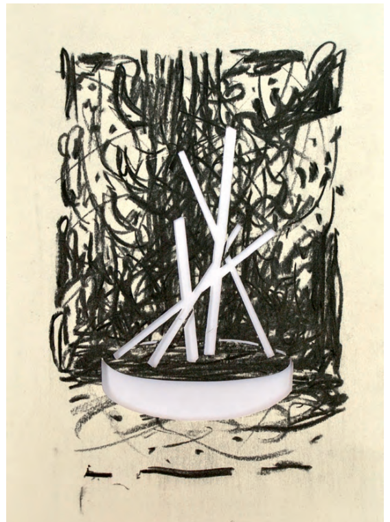
„Moderniste VIII“ · charcoal on paper, cutout, 30 x 20 cm, 2017