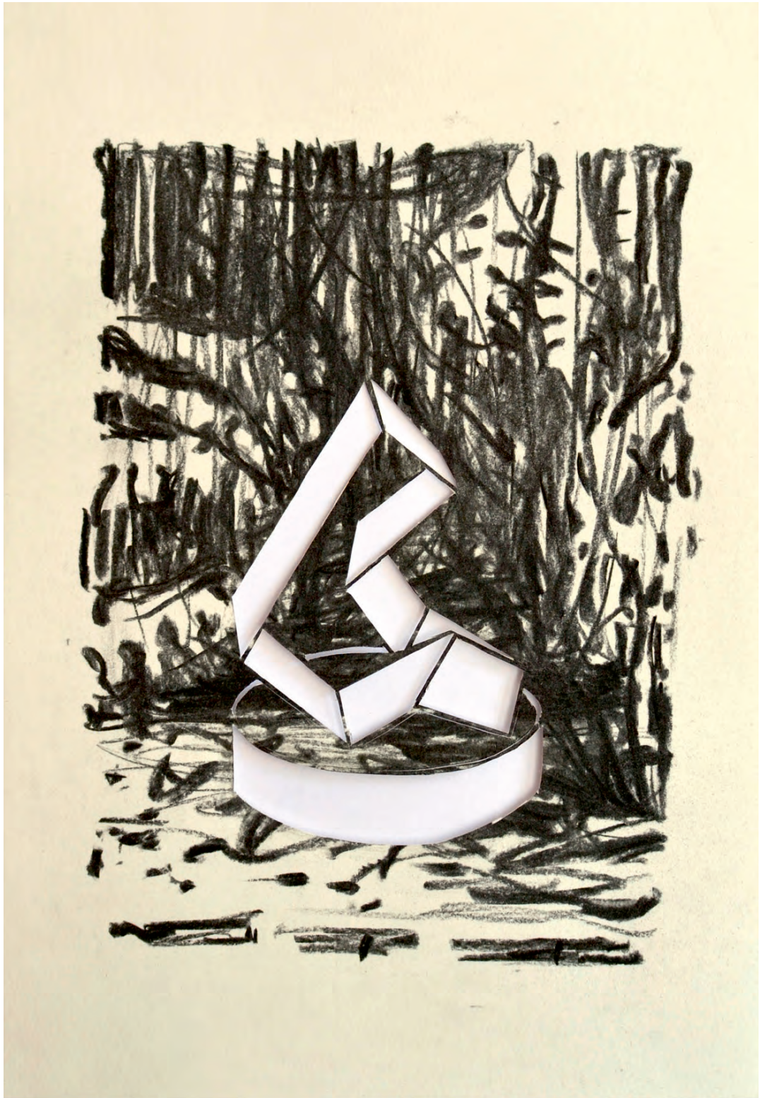
„Moderniste V“ · charcoal on paper, cutout, 30 x 20 cm, 2016