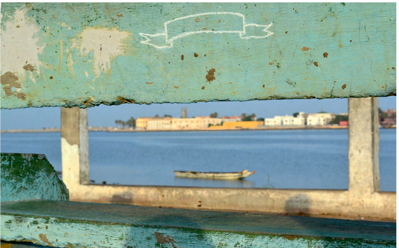
„L'éphémère disparu“ (Sor, Corniche) · chalk, drawing in public space, Saint-Louis, Senegal, 2013”