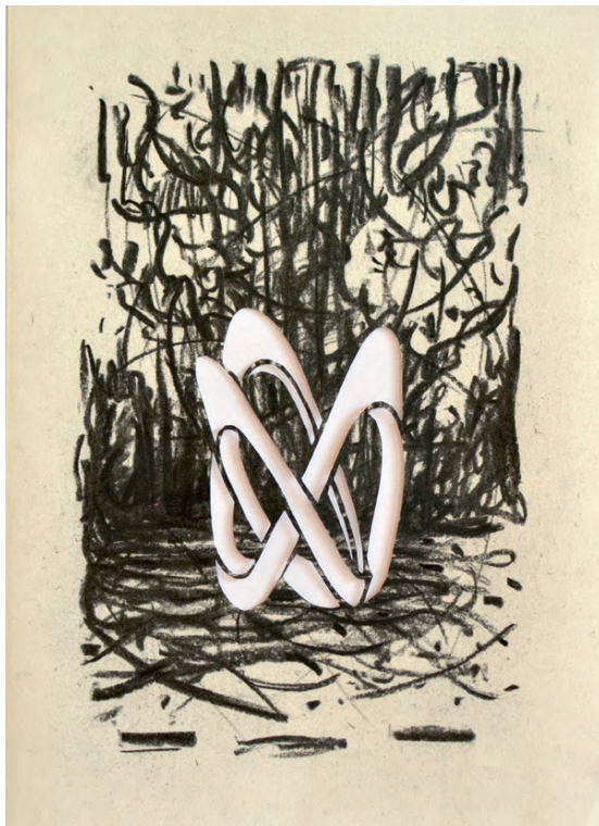
„Moderniste VII“ · charcoal on paper, cutout, 30 x 20 cm, 2017