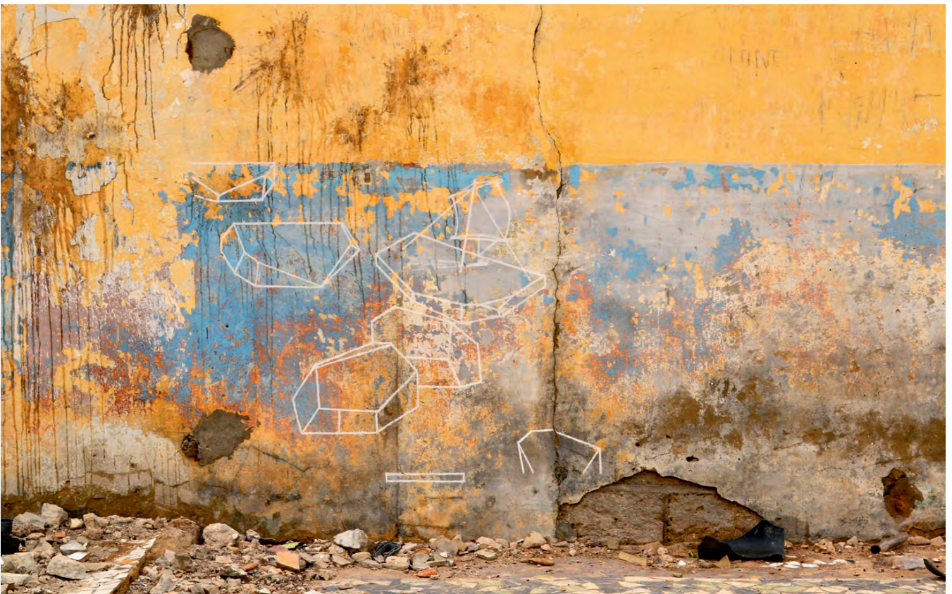
„L'éphémère disparu“ (Rue Servant) - chalk, drawing in public space, Saint-Louis, Senegal, 2013“