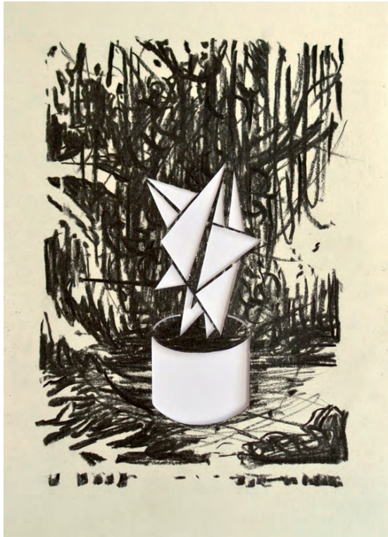
„Moderniste II“ · charcoal on paper, cutout, 30 x 20 cm, 2016