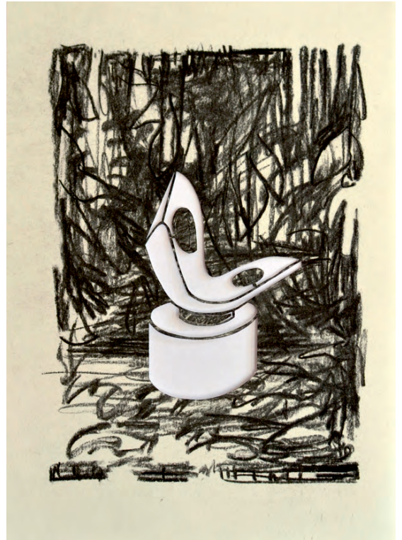
„Moderniste III“ · charcoal on paper, cutout, 30 x 20 cm, 2016