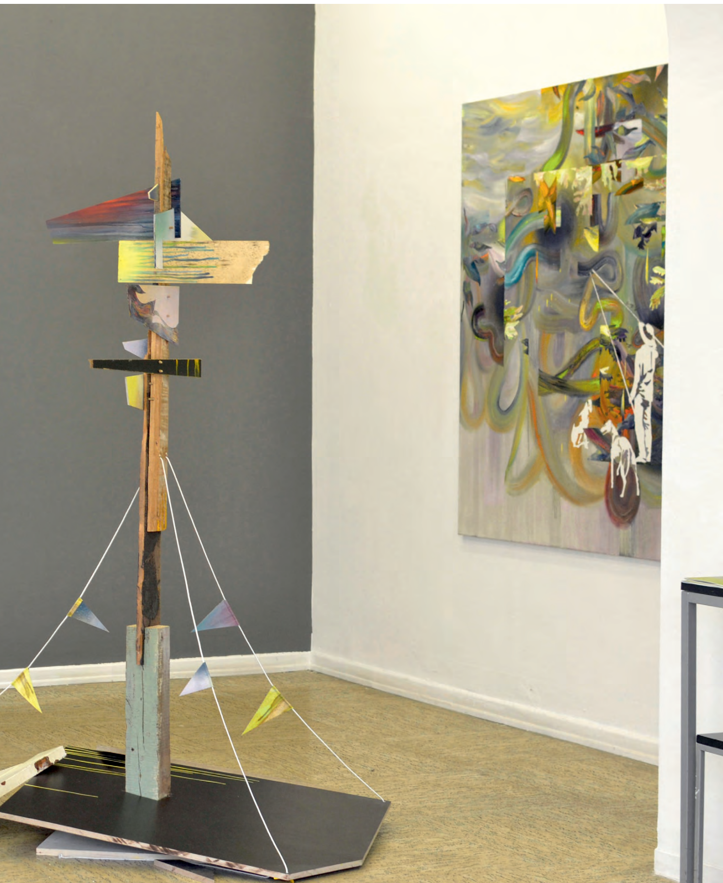
„Pentimenti Panorama“ · oil, varnish on wood and canvas, 160 x 140 x 40 cm, Exhibition view Galerie Greulich, Frankfurt/Main, 2015