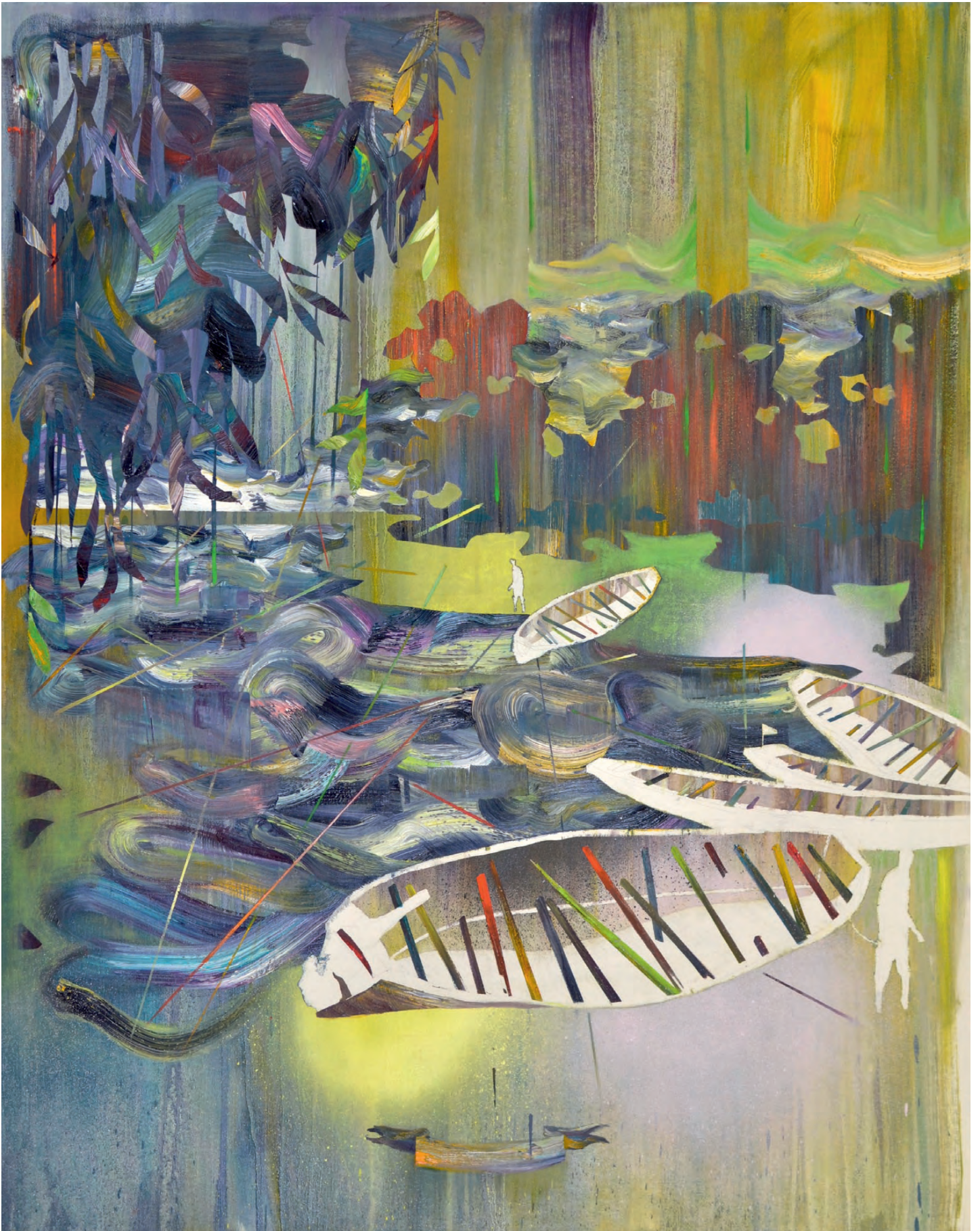
„Mikado“ · oil/varnish on canvas, 120 x 95 cm, 2015