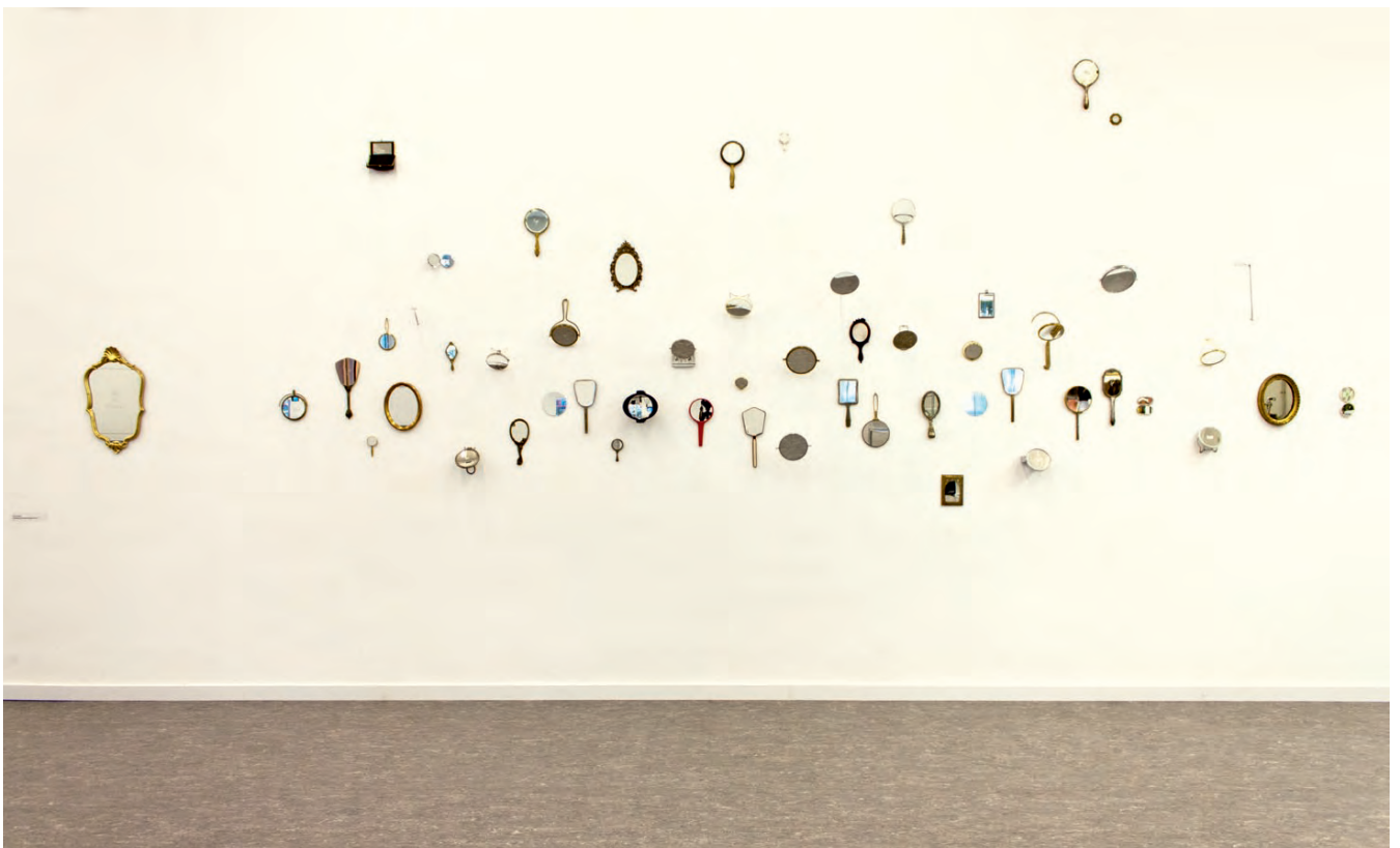
Exhibition view, Goethe Institut, Barcelona, Spain