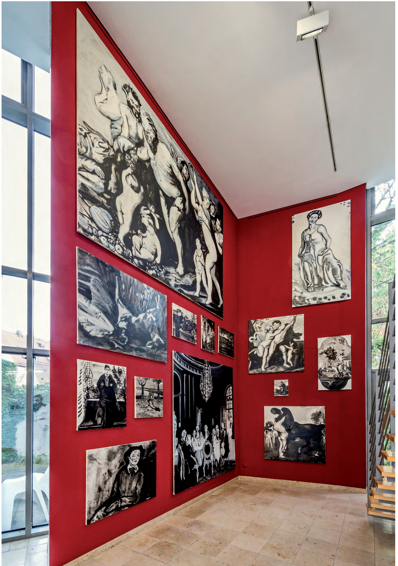
Lost Paintings, 14 paintings | oil & ink on canvas | different sizes, Exhibition view, Kunstverein Augsburg