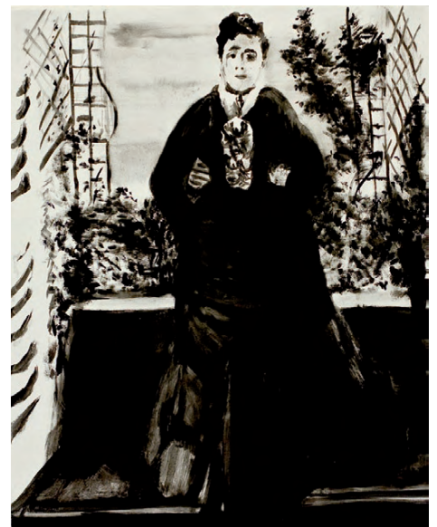
f.l.t.r.: Hodler 180 x 90 cm, Cezanne 48 x 58 cm, Renoir 67 x 54 cm, Goya 32 x 24 cm, all Oil & Ink on Canvas