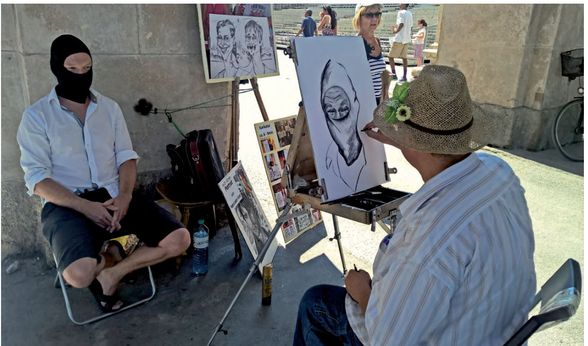
Salzburg, Austria & Seoul, South Korea