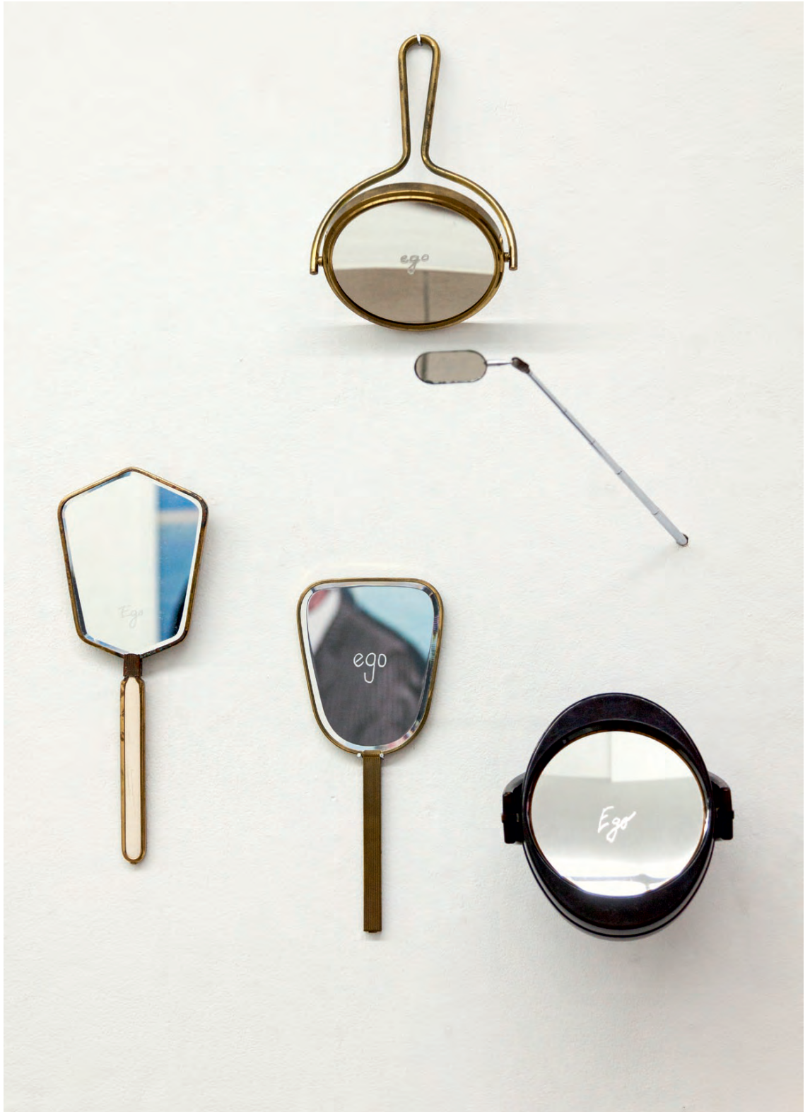
Exhibition view, Axel Obiger, Berlin (Egoismen Detail)

I realize an installation of mirrors which all are engraved with the word „Ego“.