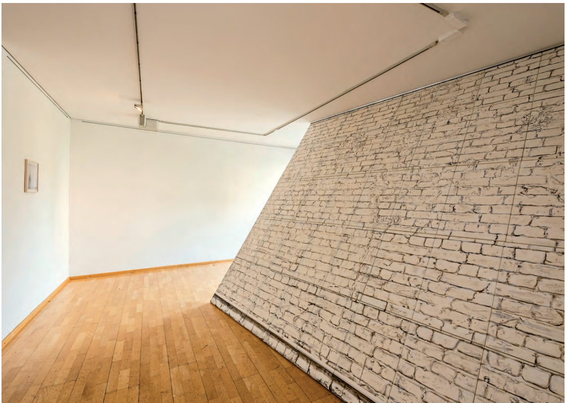
Mural Painting / Telekinesis, Exhibition view Kunstverein Augsburg, Germany